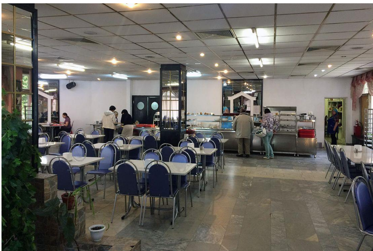
Фото 1 – линия раздачи

Площадь, передаваемая по договору безвозмездного пользования – 42,2 кв. м