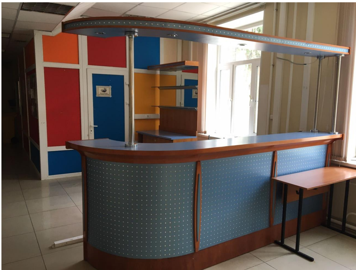
Фото линии раздачи и обеденного зала

Общая площадь зоны раздачи и вспомогательного помещения – 28,1 кв.м