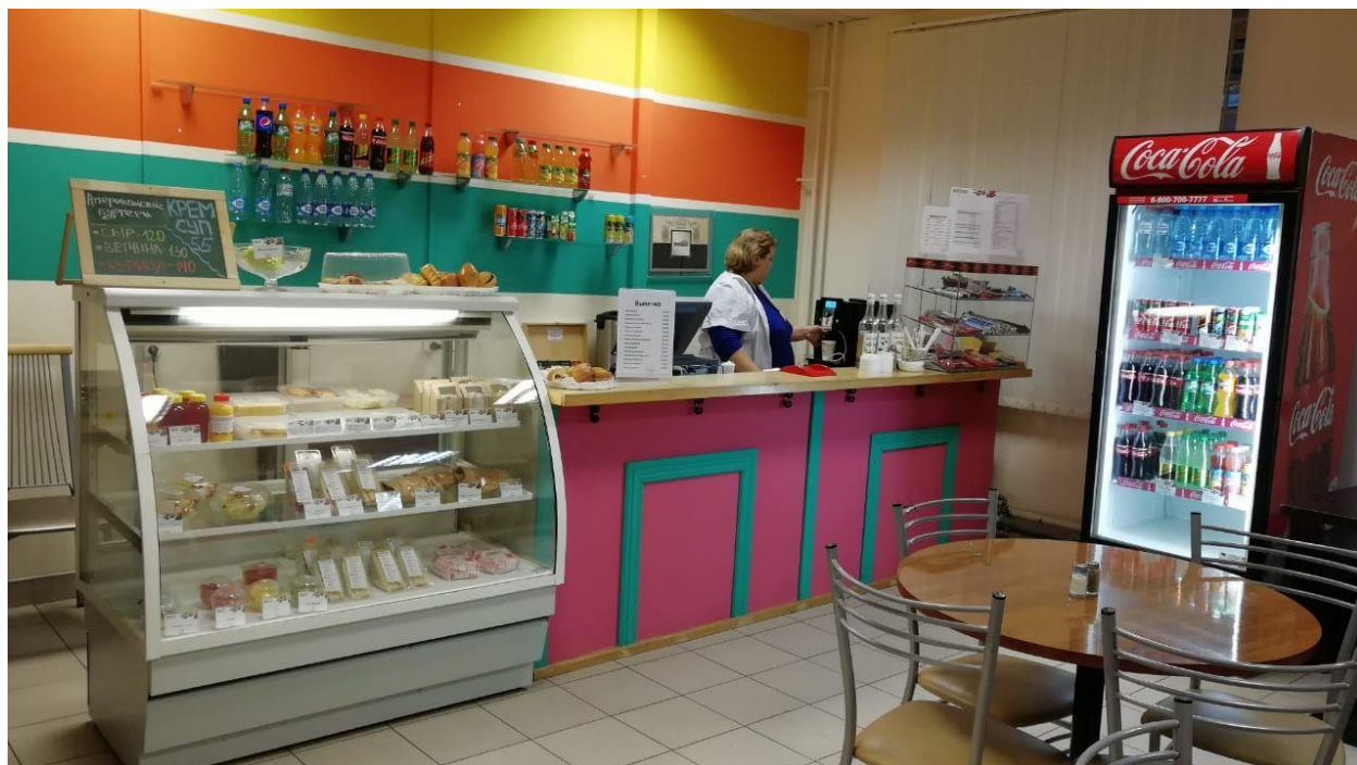
Фото – линия раздачи

Имеющееся оборудование – буфетная стойка